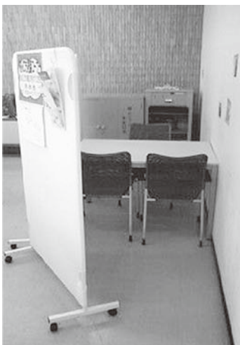
図1 なんでも相談コーナーの様子

なお、学生相談は基本的に学生および科目等履修生を対象としているのだが、卒業生や保護者さらには教